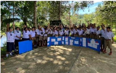
โรงเรียนตำรวจตระเวนชายแดนบ้านยางโพรง อ.ไชยา จ.สุราษฎร์ธานี

โดยในวันที่ 8-11 กันยายน 2563 ทีมวิทยากรได้ลงพื้นที่เพื่อประเมินโครงงานวิทยาศาสตร์ของนักเรียนระดับชั้นที่ 2 ร่วมกับครูผู้สอน ณ โรงเรียนตำรวจตระเวนชายแดนที่เข้าร่วมโครงการ และให้ข้อเสนอแนะ เพื่อพัฒนาทักษะการเรียนรู้ผ่านโครงงานวิทยาศาสตร์แก่นักเรียนต่อไป