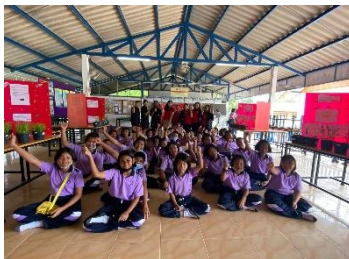
โรงเรียนตำรวจตระเวนชายแดนเทคนิคเนินปุรุอนุสรณ์ อ.พระแสง จ.สุราษฎร์ธานี