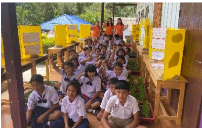
โรงเรียนตำรวจตระเวนชายแดนบ้านคลองวาย อ.วิภาวดี จ.สุราษฎร์ธานี